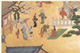
京洛名所図屏風(部分) 江戸時代

豊臣秀吉亡き後に北政所が創建し、江戸時代を通して豊臣・徳川の両家と関わりを深く存続した高台寺。大坂の陣400年目にあたる今年の特別展では、高台寺に伝わる秘宝を順次公開し、桃山から江戸へ、波乱と変化の時代を生きた人々の足跡をたどる。