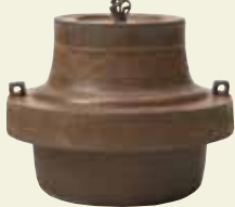
大西家六代浄元 作 車輪釜

絵画的な自然の風景や植物、動物、幾何学模様など、茶の湯釜に描かれるさまざまな文様を紹介。大西家に伝えられた文様の下絵や図案、書画作品も集め、硬質な茶の湯釜の印象をやわらかくも華やかにする文様の魅力を探る。