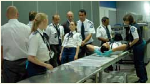
Still from Aemout Mik, Touch, rise and fall, 2008. Video installation.