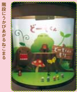
こんなところにもどーもくんが!