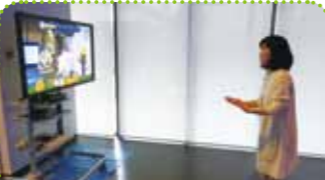
思わず夢中になって体を動かしてしまう

玄関を入ってすぐのところにある「一緒に遊ぼうキャラクターゲーム」には、画面前の人の動きを検知するカメラが搭載されている。体を動かすことでプレイできるゲームを楽しんだ後、記念撮影もしてくれる優れものだ。