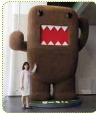
触ることもできる 巨大どーもくん