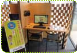
PC端末を使用して大河ドラマなどを観ることができる

開放感のある2階も一般公開部分。その通路奥にあるのが、NHK 番組公開ライブラリーだ。およそ80年前～現代まで、約9000本にもおよぶ番組の映像を無料で視聴できる。ほかにも2階通路がギャラリーとなっており、今後の展開に注目が集まる。