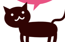
NHK京都のキャラクター ねこまる