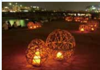
風鈴の音色に懐かしさを感じる、鴨川会場の「風鈴灯」

開催場所 堀川会場／堀川遊歩道(御池通～一条戻橋付近)周辺、鴨川会場／鴨川河川敷(仏光寺通～御池通)、梅小路公園会場(梅小路公園)、岡崎会場(岡崎公園周辺)、北野紙屋川会場(北野天満宮周辺)、二条城会場(城内)、京都府立植物園会場(京都府立植物園) ☎075-222-0389 (京の七夕実行委員会事務局 京都市観光MICE推進室内)