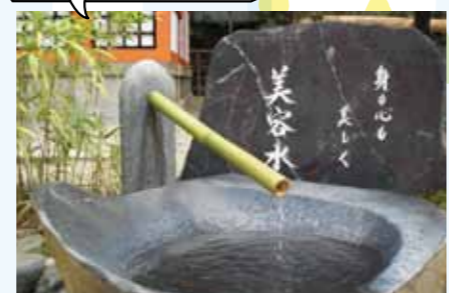
参拝する女性に人気の「美容水」