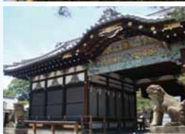
府の指定重要文化財である拝殿