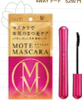
もてますカラ[ロング] 1,944円

コスメの宝宝箱のようなお店からの一押しは、デザイン、中身ともに新しくなった大人気の「もてますカラ」。まるで自まつ毛がそのまま伸びたかのような自然な仕上がりが、美容液成分配合でまつ毛に優しく、お湯ですलッと落とせるのも魅力。