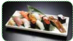
板前が握る上にぎり、2,100円