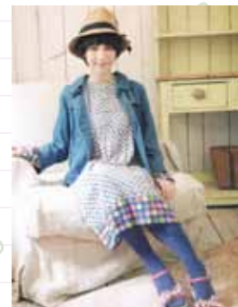
ワンピース エレファントパレード 5,400円

行けばいつでも、ホッとするようなあたたかさがある。そんなお店からのおすすめは、一枚でさらりと着られるスタンドカラーワンピース。コットン100%なので、肌触りが優しく、おうちでの洗濯も可能。春らしいコーディネートが、すぐに完成です。