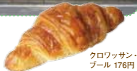
クロワッサン・オ ブール 176円