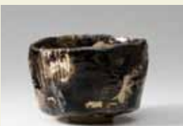
9代樂入 (1756~1834) 作 黒樂茶碗

樂家初代長次郎から15代吉左衛門、次代後継者・樂篤人までを解説する楽歴代図録の決定版「定本 楽歴代」。本に収録された代表作203点を順次紹介する展覧会第2弾を開催。樂焼450年の歴史の中に、革新し続ける各代の作陶の軌跡が浮かびあがる。