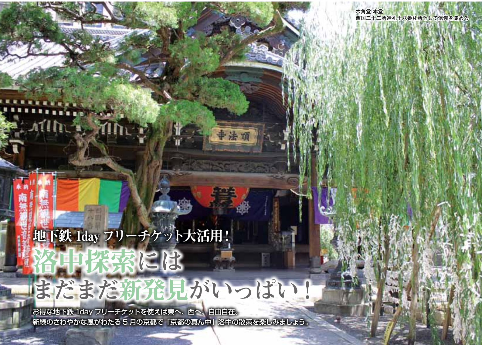
六角堂 本堂 西国三十三所巡礼十八番札所として信仰を集める

地下鉄 1day フリーチケット大活用! 洛中探索には まだまだ新発見がいっぱい!