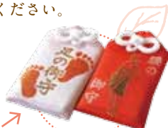
護王神社で 足腰の健康祈願を