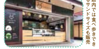
店内では食べ歩きできるサンドサイズも販売

075-881-9520 9時～18時(季節により変更します) 無休 京都駅前から徒歩28分 嵐山天龍寺前下車、徒歩約1分