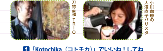
小川珈琲のバリスタが繊細なラテアート

バンドの生演奏に合わせて披露する、美しいラテアートをご覧ください! 日時: 3/21(金・祝) 17時～18時15分(各回約45分) 場所: 京都駅(コトチカ広場)