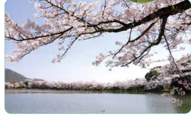
さまざまな桜が大沢池の畔を春色に染める

嵯峨天皇の離宮を寺に改め、数々の天皇や皇族が入寺した門跡寺院。平安時代に唐の洞庭湖に倣って造られた大沢池の周囲には、約1kmにわたり桜が咲き乱れる。また勅使門横に植えられた枝垂桜も必見。