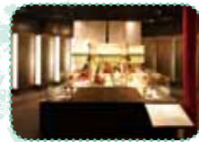
歌の場面を華麗に再現した舞台