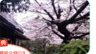
特典 にしんそば消費税割引 (3月14日～4月14日) 店の前にある大きな桜が目印

075-861-0342 10時30分～17時30分 不定休 京都駅前から徒歩28分 大覚寺下車すぐ