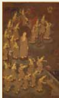
「重文」回廊院 滋賀・新知恩院

面や装束を身に付けて仏菩薩に扮した人々が、極楽浄土に迎える様子を演じる「練り供養」。岡山・弘法寺や奈良・當麻寺など、各地に残る練り供養の遺品や、練り供養成立の背景となった浄土教美術の優品を紹介する。