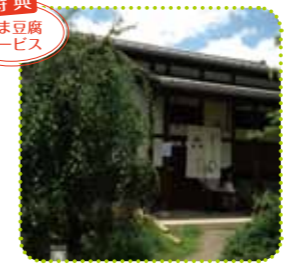
落ち着いた佇まいの中、ゆっくりとそばを堪能できる

☎075-711-6494 ◎ 11時45分~17時 ※売切れ次第終了 ◎ 月曜・第4火曜(祝日の場合は翌日) 地下 北山駅下車、徒歩約7分