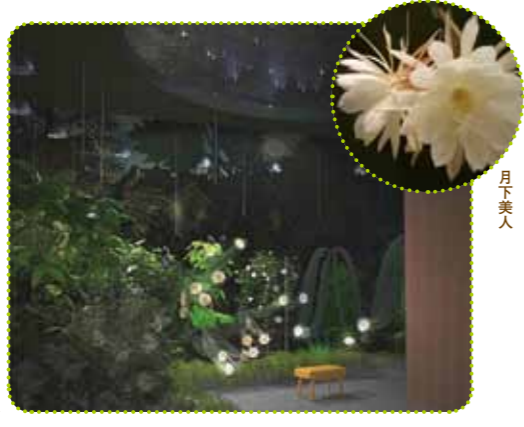
暗闇に浮かび上がる花はどこかエレガントな印象

観覧温室の北側に新設。昼間に夜の空間をつくり出し、「月下美人」や「ヨルガオ」など、夜に咲く美しい花や植物を展示する。