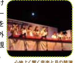
心地よく響く音楽と月の観賞

大芝生地に設けられた特設ステージで中秋の名月を観賞。当日は野外音楽会や月の観察会が行われる。