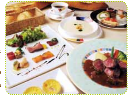
メインが4種の中から選べるスペシャリティコース2,500円

☎075-712-2710 ◎ 11時~21時(ランチ 11時30分~14時、ディナー17時~21時) ◎ 第1・3月曜(祝日の場合は翌日) 地下 北山駅下車、徒歩約2分