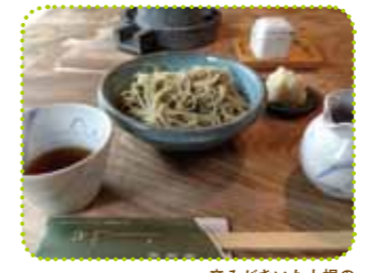
辛みがきいた大根の おろしそば(冷たい) 950円