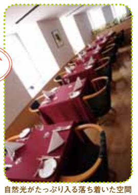
自然光がたっぷり入る落ち着いた空間