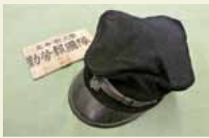
大学生制帽と腕章

☎ 075-465-8151 ☎ 9時30分~16時30分(入館は16時まで) 400円 月曜