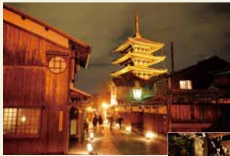
温かみのある灯りが古都の街並みややさしく照らす