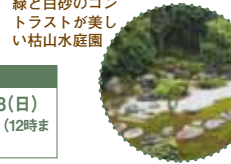
緑と白砂のコン トラストが美し い枯山水庭園

📞075-752-0227 (京都市観光協会) 🕒10時～16時 (受付終了) 🎫600円