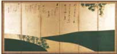
重要文化財 鶯の細道図屏風(右隻) 依屋宗達筆 相国寺蔵

名刹の境内にある静謐な空間によみがえる依屋宗達のモダンイズム。修理が完成した依屋宗達筆の「鶯の細道図屏風」をはじめ、長谷川等伯、伊藤若冲、長沢芦雪らによる屏風・襖・杉戸など、館蔵障屏画の名品を一堂に展示する。