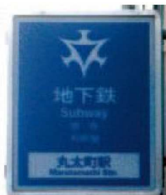
Subway Station Entrance Sign

※ When changing trains from Kyoto City Subway to a different operator, a separate ticket must be purchased to travel on the connecting train lines.