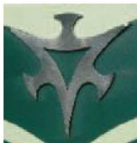
① Symbol Mark of City Bus

目的のバス停が近づき、バス停名がアナウンスされたら、窓際や座席の縁にある降車ボタン(③)を押してください。前のドアから降車しますが、降車の際は、必ず運賃箱横のカード読取機(④)にバスを通してください。