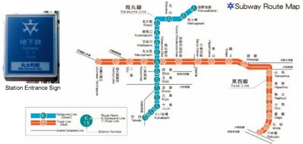
Station Entrance Sign