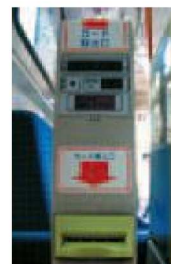
② Card Reader