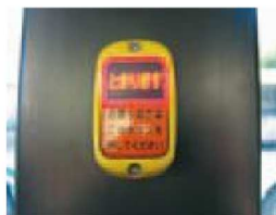
③ Button to Request Stop