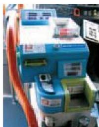
④ Fare Machine