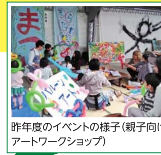
昨年度のイベントの様子(親子向けアートワークショップ)

本市と大学コンソーシアム京都が、大学と地域の皆さまが連携する事業を支援する「学まちコラボ事業」。 この度、北区で活動する次の取組が認定されました。