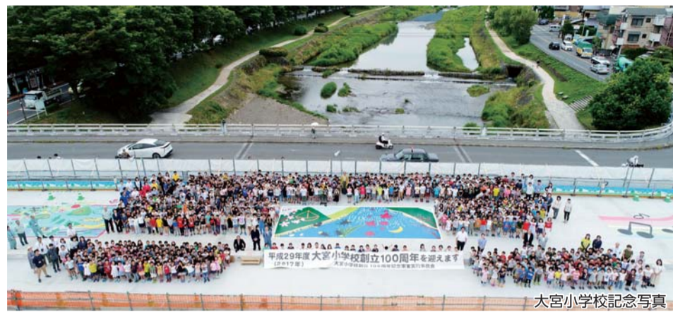
大宮小学校記念写真

今年創立100周年を迎える大宮小学校と、近隣の上賀茂・柊野小学校の子どもたちがアスファルト舗装前の新しい御菌橋の上に集合！ 賀茂川の流れや昆虫などをモチーフにした巨大アートをお披露目してくれました。 この巨大アートは今後舗装されて見えなくなりますが、子どもたちの最高の思い出になったことでしょう！