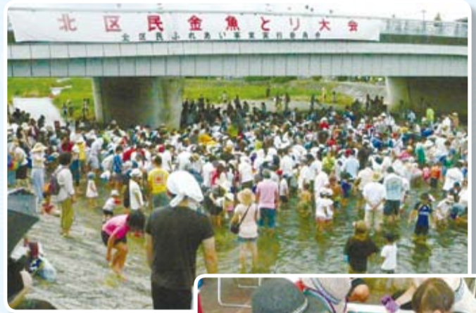
(写真は昨年度の様子)