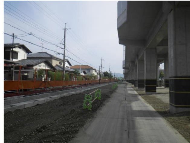
第二工区 Rc16（南→北を撮影）