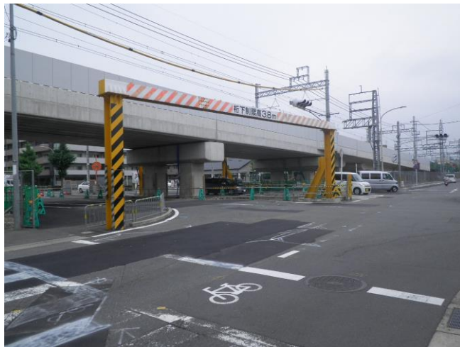
第三工区 P 3 3 川岡下三番踏切 (東→西を撮影)