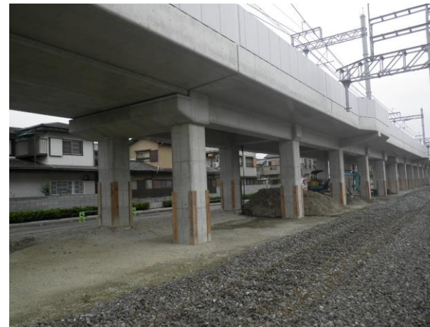
第三工区 R c 2 7 (南→北を撮影)