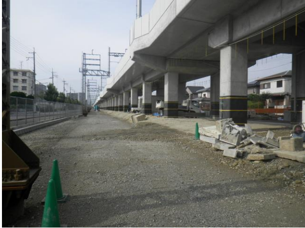
第二工区 仮線路部（北→南を撮影）