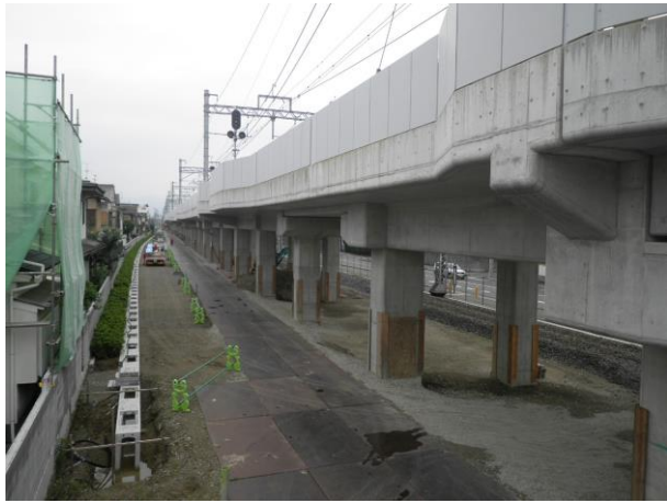
第三工区 R c 2 6 (南→北を撮影)