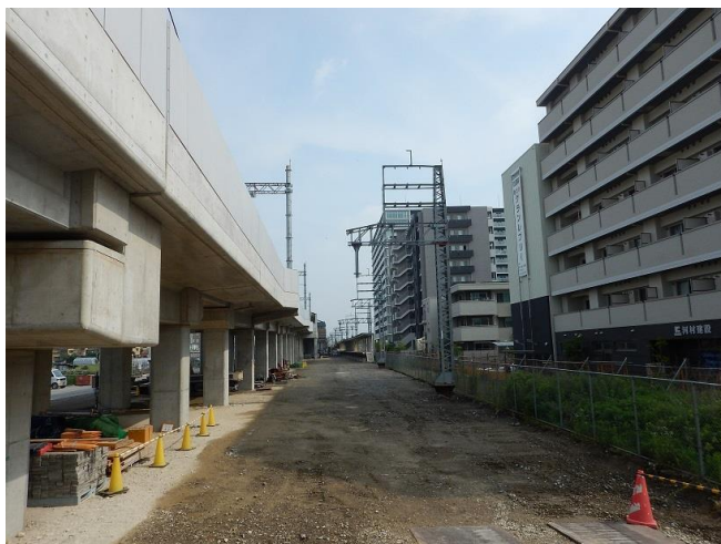
第一工区 仮線路部（南→北を撮影）