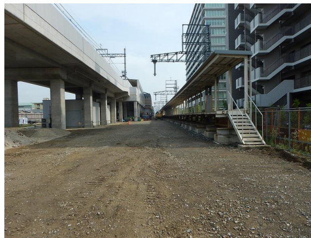
第一工区 旧駅舎部分（南→北を撮影）