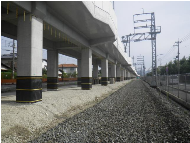
第二工区 仮線路部（南→北を撮影）