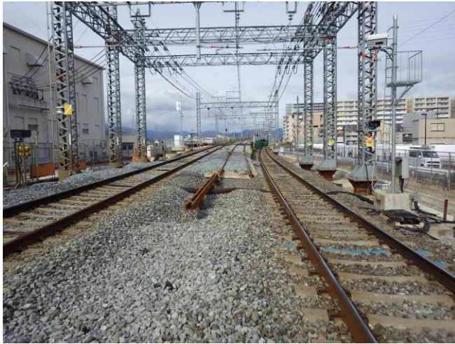
第一工区 起点部 (南→北を撮影)