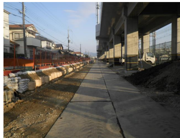
第二工区 Rc16 (南→北を撮影)