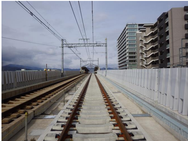
第一工区 Rc7 (南→北を撮影)