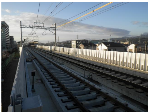
第二工区 Rc15 (北→南を撮影)