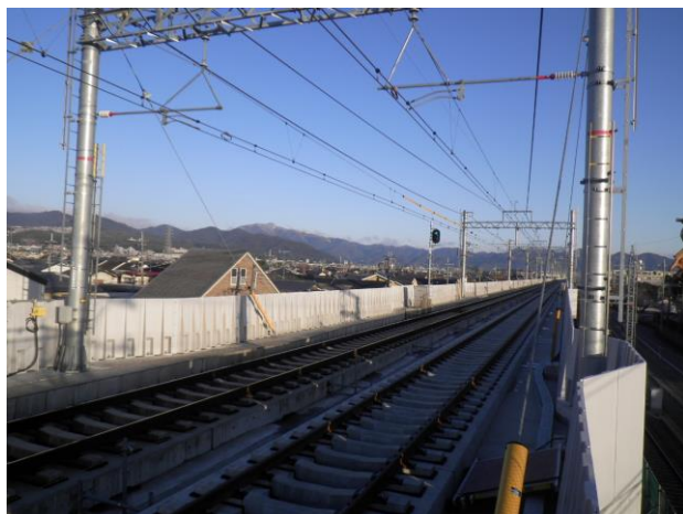
第二工区 Rc17 (南→北を撮影)