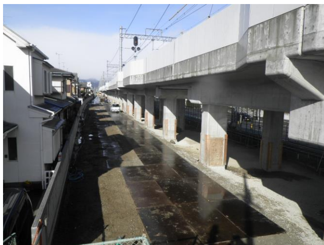
第三工区 Rc26 (南→北を撮影)