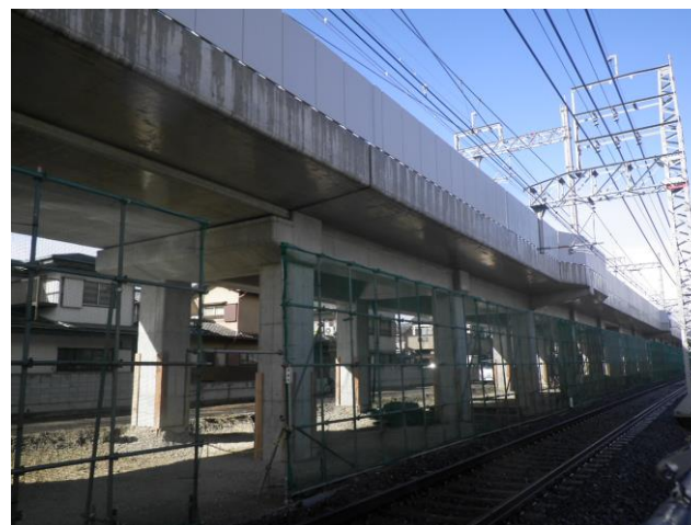
第三工区 Rc27 (南→北を撮影)