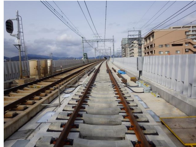
第一工区 Rc5 (南→北を撮影)