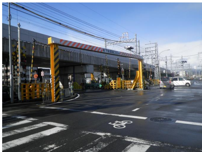
第三工区 P33 川岡下三番踏切 (東→西を撮影)