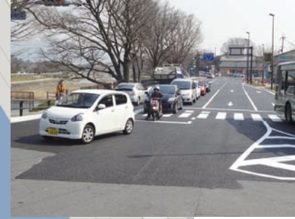
② 歩道を拡幅しました。