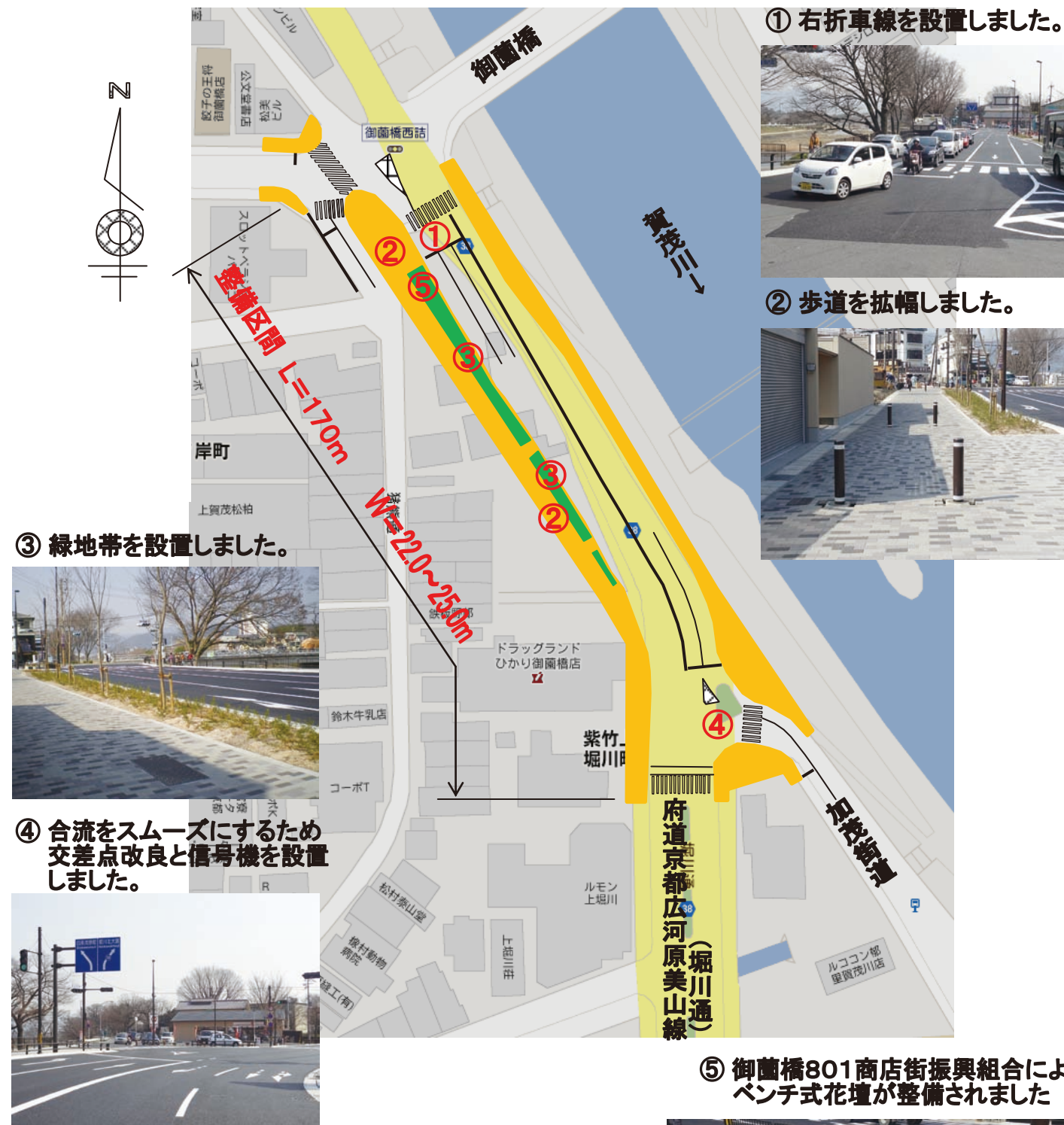
① 右折車線を設置しました。