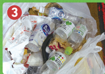
3 ペットボトル・缶・びん