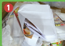
1 リサイクル可能な紙類