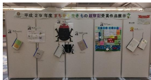
ゼスト御池寺町広場での展示