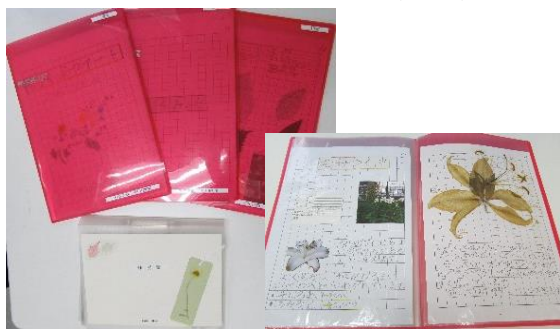
個人の部「しょくぶつアート」