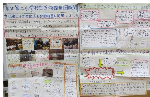
団体の部「京北第二小学校生き物探偵団新聞」