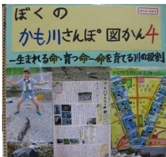
個人の部「ぼくのかも川さんぽ図かん4」