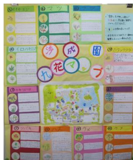
団体の部「渉成園九花マップ」