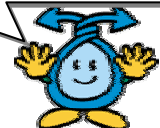
ごみ減量 マスコット 「めぐくん」

制度導入で、家庭から排出されるごみ(定期収集ごみ)が20%減ると予測しています。より良い地球環境を次の世代に引き継ぐことは、今を生きる私たちの使命です。ごみ減量とリサイクルの一層の推進は、二酸化炭素などの温室効果ガスを削減することができ、地球環境問題の解決につながります。