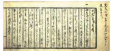
岩倉具視日記 (文久2年9月13日条)〈重文〉