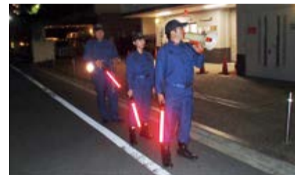
消防分団による夜回り