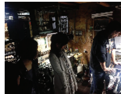
西陣織工房見学(りんどう屋)