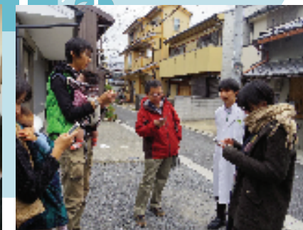
まちぐるアプリ開発実験室(ANEWAL Gallery)