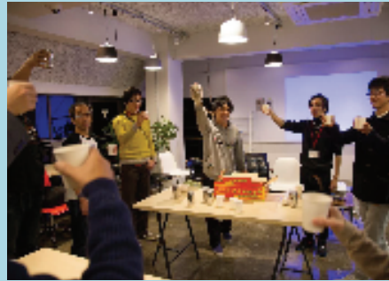
上京OW2016、キックオフイベント(385PLACE)

京都市上京区は昔から御所や公家屋敷を擁し執政の場として、西陣織に代表される伝統産業の場として、商店街などの生活の場として様々な場とそこに暮らす人々によって形成されてきました。そして今の上京区にも様々な活動を行う魅力的な人たちが多くいます。まちづくりをする人、商店街を盛り上げる人、歴史を継承する人、そしてそれらに関わる場所。上京区内で普段すれ違い、通り過ぎる人や場所の紹介をする期間、それが上京OPENWEEKです。