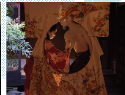
円窓 -MOON à NOOM-(ANEWAL Gallery)