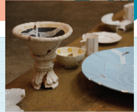
岩能力也ワークショップ in 堀川団地「こむすことなおすことそのまき」(堀川common)