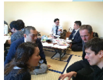
上京朝まっ茶カフェ(上京区総合庁舎 4階和室)