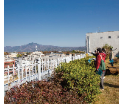
上京スカイツアー(上京区内の屋上)