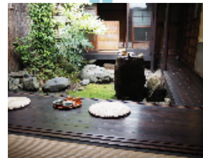
オープンガーデン -フリーペーパー読破の庭-(ANEWAL Gallery)