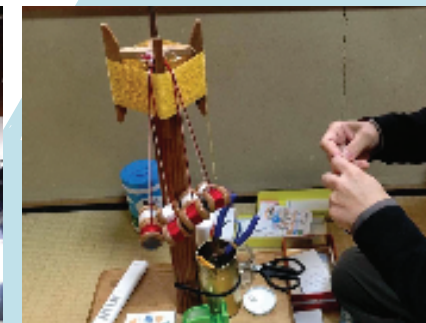
抹茶カフェ「鳴橋庵茶会」with 京くみひも体験(京都桐壺庵)