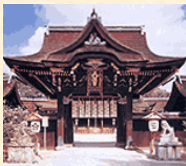
北野天満宮（三光門）

翔鸞の由来は、平安京の応天門の回廊の一端にそびえていた「翔鸞楼」にちなんで名付けられたものです。