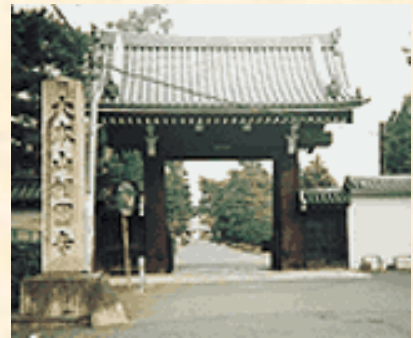
臨済宗相国寺派大本山

烏丸通の今出川を東に足を運べば、小倉百人一首の選者として知られる藤原定家を祖にもつ、現存する最古で唯一の公家建築である冷泉家住宅、足利3代将軍義満が幕府の安定後、参禅弁道の道場として自身を鍛えるために建てたとされる相国寺があります。