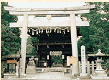
御霊神社（上御霊神社）

その北には、平安遷都にあたり、長岡京で犠牲になった早良親王らの怨霊の鎮めが創祀と伝えられる上御霊神社が鎮座し、寺町通には秀吉により集められた各寺があり賀茂川に至ります。