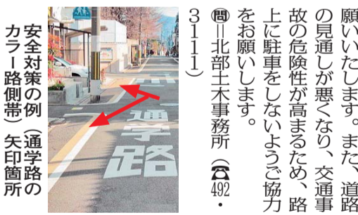
安全対策の例(通学路のカラー路側帯) 矢印箇所

スのチューダー様式を取り入れ、急こう配の屋根やハウスティンバー(半木造)という太い柱型を見せて環境に配慮したのでしょ。京都市の登録有形文化財でもあります。隣接する地下鉄の入口にもそのデザインが生かされています。(い)