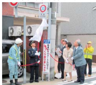
3月8日の開始式の様子

上京区内で初めてのゾーン30が室町学区内に設置されました(今出川通~烏丸通~寺之内通~新町通に囲まれた区域)。ゾーン30とは、歩行者や自転車の安全を守るため、生活道路として使用している区域を定めて時速30キロの最高速度規制を実施するものです。