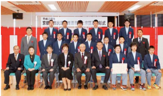
嘉楽中学校野球部

3月11日、市民憲章推進者上京区長表彰式が区総合庁舎で行われ、まちの美化、安心・安全なまちづくり活動、福祉活動などを長年続けておられる次の方々に、表彰状が贈られました。(敬称略。括弧内は学区)。