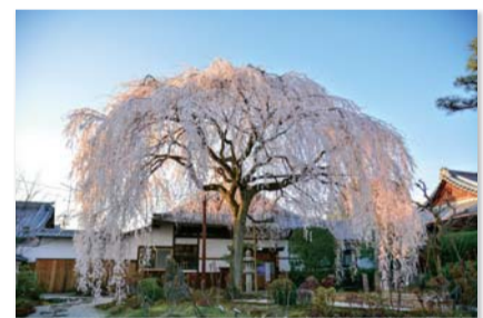
彩りの京都「かみぎょう」 フォトコンテスト応募作品より