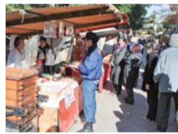
「天神さん」での露店指導の様子

毎月25日は、北野天満宮の参道や周辺道路に多くの露店が立ち並び、参詣者や観光客のお楽しみとして賑わっています。上京消防署