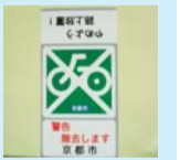
やめよう路上放置!表示

北部土木事務所では、撤去強化区域で1年を通じ、放置自転車防止の啓発活動を行っています。道路上に自転車を放置することは、通行の支障となるだけでなく、小さなお子さまや高齢の方、身体に障害のある方にとって大変危険で、ケガの原因にもなります。すぐに移動できない状態であれば、短時間でも「放置」となります。