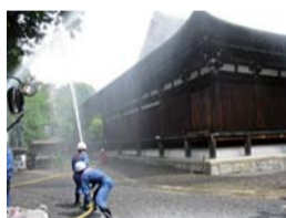
大報恩寺での消防訓練の様子

北野天満宮(天神さん)の本殿と大報恩寺(千本釈迦堂)の本堂は、文化財の中でも特に重要とされる「国宝」に指定されています。私たちは、「日本国民の宝物」であるこれらの建物を、火災をはじめとする災害から守り、後世に伝えていかなければなりません。