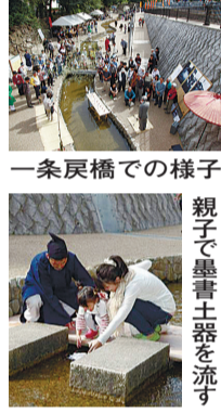
親子で土器を流す様子

日時 10月20日(日) 午後1時～午後4時 場所 堀川一条戻橋から堀川第一橋の間(雨天時は元西陣小学校体育館) 料金 無料 申込み 不要 主催 上京歴史の町協議会(上京区民まちづくり活動支援対象事業) ☎＝市埋蔵文化財研究所 (☎415-0521)