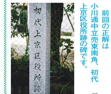
初代上京区役所跡

前回の正解は、小川通中立売東南角、初代上京区役所跡の碑です。 多数のご応募ありがとうございました。 明治十二年に京都府上京区が誕生しますが、区役所が建てられたのは、明治十六年になってからです。昭和十三年に今出川通新町