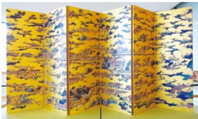
上杉本洛中洛外図屏風（米沢市蔵）複製パネル

応仁の乱後に復興した上京のようすを描いた『上杉本洛中洛外図屏風』の複製パネルが展示されています。また、