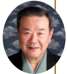
武者小路千家 第十四世家元 公益財団法人官休庵 理事長

「家元制度の一つのメリットとどうか機能は、上手に周りから育てていくシステムになっていることですね。ある日突然宣告して、『お前は後継ぎや、しっかりやらんとあかん』と云うのではなく、いわゆる職住一致の環境の中で、親や周りの人間から『あなたはこういう家に生まれたのだから、将来はこうなる』と