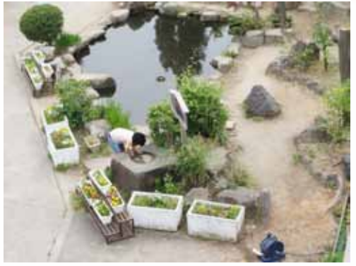
室町校にある百々橋の礎石

て石橋に改められた。御影石造りの立派なもので、寺之内通の東西を行き交う人たちに大いに利用されていたが、一九六三年の暗渠化で役割を終えた。