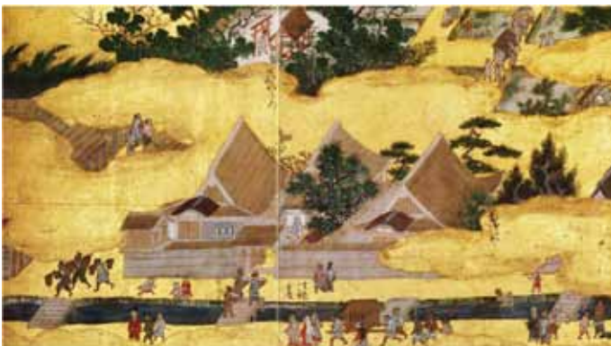
上杉本洛中洛外図屏風（米沢市蔵）に見える小川（宝鏡寺・百々橋辺り）