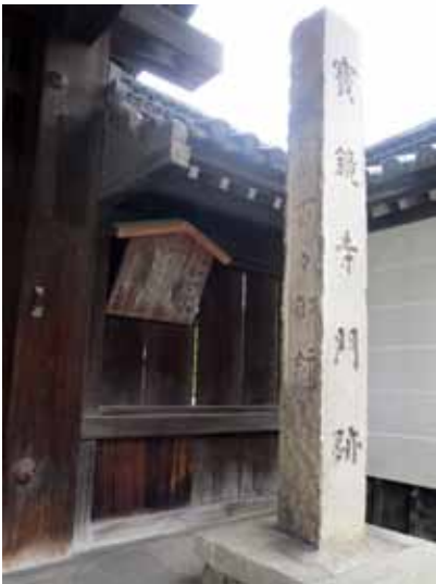
寶鏡寺の門柱には舊百々御所の文字

四十年後の一五〇七(永正四)年、勝元の子政元の後継ぎをめぐり、先に養子になったものの廃嫡させられた澄之