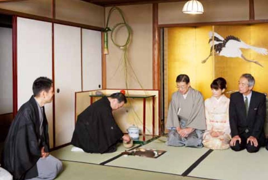
本年の家元初釜にて、山田啓二京都府知事ご夫妻、伊吹文明衆議院議員に茶を呈する