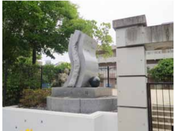
小川と太陽のモニュメント

小川は「こかわ」とも「こがわ」とも「おがわ」とも呼ばれ、川としては「こかわ」あるいは「こがわ」。小学校名は発足当初から「おがわ」で貫かれた。川が、学校がなくなっても、地元の人たちの小川への愛着は今も変わらず、同校跡敷地内には「小川」「今出川橋」の親柱が残り、二〇〇五（平成十七）年施