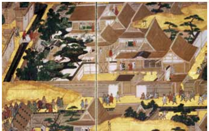
上杉本洛中洛外図屏風（米沢市蔵）に見える細川邸