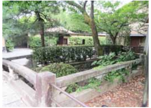
本法寺前の石橋から裏千家を望む

架す。石橋なり。長さ四間一分(七・五メートル)幅二間二分(四メートル)「この橋、幽雅にして野趣あり。街道を往復する者、ここに休憩す」とあり、「都下の名橋なり」と讃えられるが、「今昔物語集」には、「夜更けの橋の上に青衣着物姿の妖女が一人ぼつんと立っていた」「上目づかいににっこりと笑い、ここを通った都人は余りの凄さに肝をつぶして逃げ去った」との、気味悪い話も書かれている。