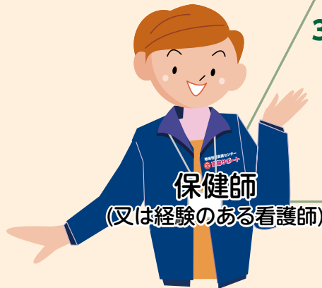
保健師 (又は経験のある看護師)