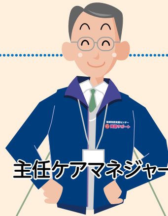
主任ケアマネジャー