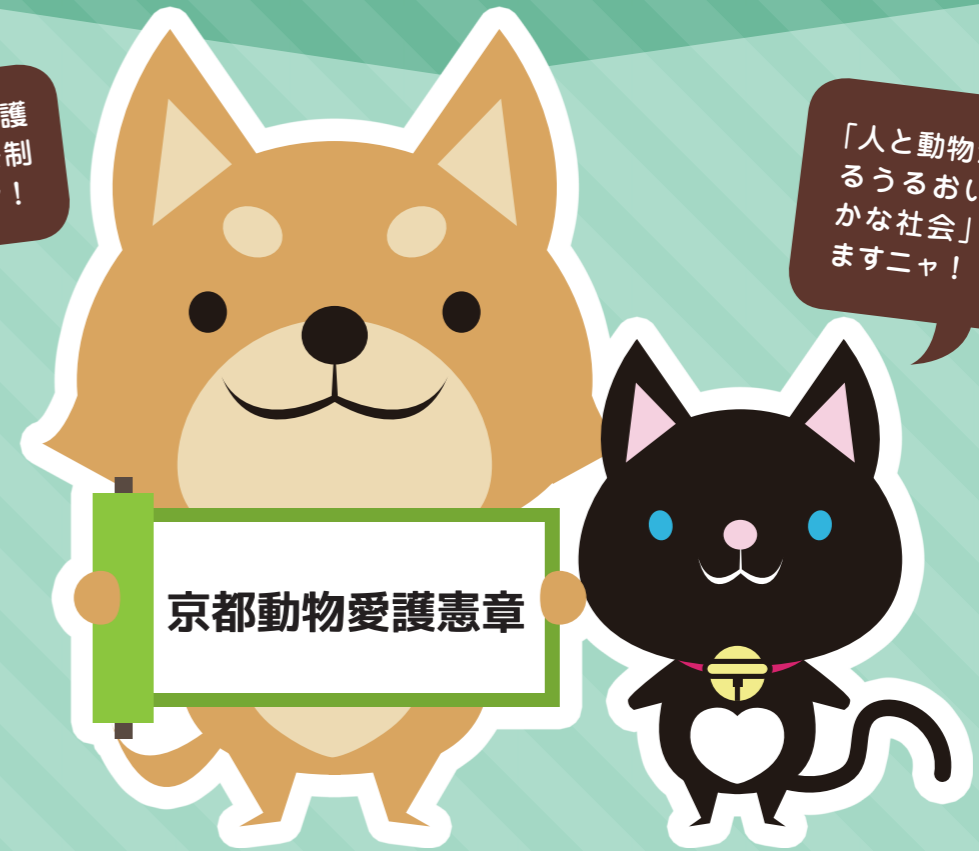
「京都動物愛護センター（仮称）」（愛称：動物愛ランド・京都）キャラクター 京（きょう）ちゃん 都（みやこ）ちゃん

京都府と京都市では、府市共同による「京都動物愛護センター（仮称）」（愛称：動物愛ランド・京都）の設置（平成27年4月予定）を契機として、「人と動物が共生できるうるおいのある豊かな社会」の具体的な姿を示し、様々な人々がそれぞれの立場から動物愛護のあり方について自ら考え、積極的に行動するためのよりどころとなる「京都動物愛護憲章」を制定しました。