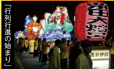
「行列行進の始まり」