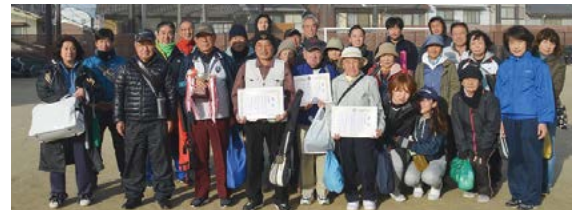
総合優勝 今熊野学区のみなさん