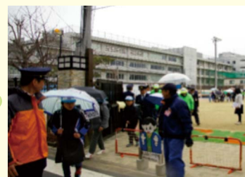
3月1日 東山泉小中学校

問合せ 地域力推進室(☎561-9105) 東山警察署 生活安全課(☎525-0110) 東山消防署 予防課(☎541-0190)