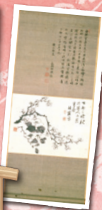
重要文化財 梅椿図

応募期間 8月19日(金)～9月23日(金) 対象 市内在住または通勤・通学の方 募集人数 400名(1組5人まで・先着順) 参加費 一般1人 1,500円 高校生1人 1,000円(中学生以下無料) 応募方法 「京都いつでもコール」へ電話・FAX・電子メール(4面カレンダーに掲載)で申込み ※FAX・電子メールの場合は「東山文化財鑑賞会参加希望」とし、①氏名(ふりがな)、②〒・住所、③電話番号、④年齢、⑤2人以上で申込みの場合は同伴者全員分の氏名(ふりがな)を明記してください。 ※学生の方については当日受付で学生証を提示してください。