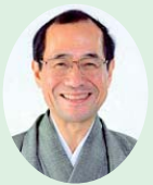
京都市長 門川 大作

東山区でも、日頃から安心安全なまちづくりにご尽力いただいている区民の皆様と力を合わせ、共々に取り組んでまいりましょう!