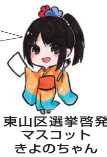
東山区選挙啓発 マスコット きよのちゃん

日常的に、高齢者を支援されている民生・児童委員や老人福祉員の方々が対象に、高齢者が生活の中で遭遇する可能性の高い事件や事故について成した開講小中学校第二教育施設六原学舎に変更します。該当する地域にお住まいの方は間違えの無いようご注意ください。