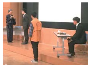
学生防犯ボランティア「ロックモンキーズ」による寸劇

の啓発を行いました。学生防犯ボランティア「ロックモンキーズ」が、高齢の方が特殊詐欺の被害にあう寸前で近所の方の気づきにより防げることができた寸劇を披露し、周囲の見守りの大切さを訴えました。