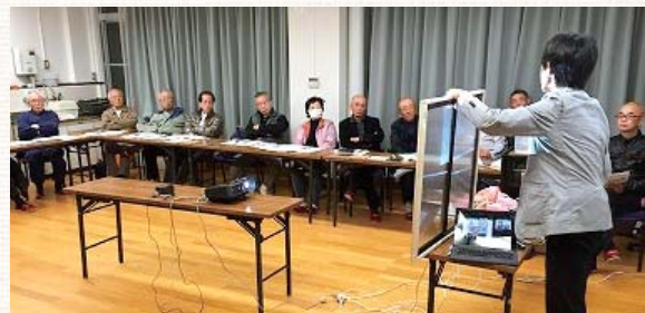
省エネに関する学習会の様子

地域ぐるみでエコ活動を実施していただくことにより、環境にやさしいライフスタイルへの転換や温室効果ガスの削減、地域力の向上を目指して「エコ学区」事業を実施しています。 東山区では、区内の全学区がエコ学区宣言を行い、使用済み容器の回収やリユース食器の利用など、環境にやさしい取り組みを進めています。