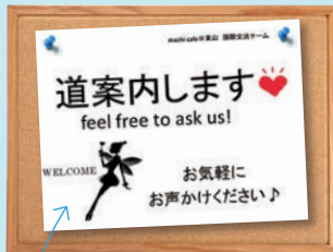
道案内声掛け看板

まちカフェで結成されたチームによる、平成26年度の活動を紹介！ 舞妓さん、国際交流、グルメ、本、婚活、瓢箪などなど、 まちカフェから生まれるアイデアはまさに“お宝”♪