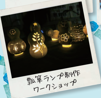
瓢箪ランパ制作 ワークショップ