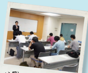
好感のもてる話し方教室