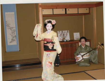
元芸妓さんに学ぶ おもてなしの心