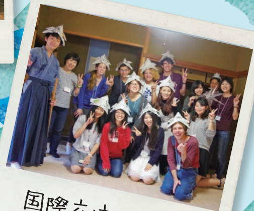
国際交流イベント