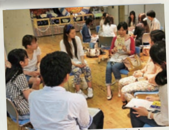
オススメ本を通じて交流 東山図書基地