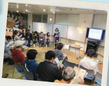
学生ビブリオバトル