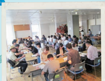
カップリングイベント 東山・愛・空間