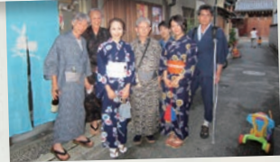
浴衣でそぞろ歩き