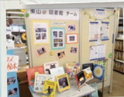
東山図書館への展示