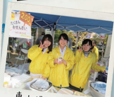
東山グルメイベント 「こちカフェ東山」