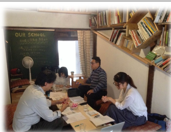
六原学区における空き家活用啓発事業 HAPS事務所での打ち合わせの様子