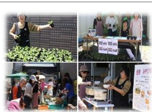
東山瓢箪プロジェクト普及へ 瓢箪苗の配布の様子（5/12）