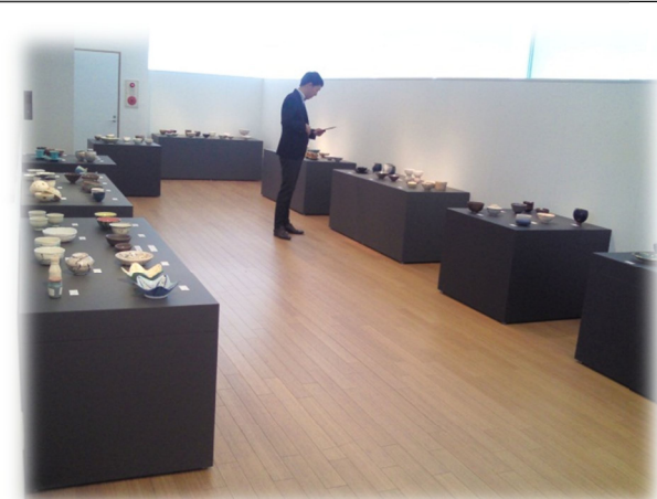
第2回「わん碗ONE」展 「次代を担う若者達の作品展」の様子（11/1）