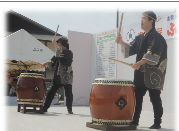
スマイルミュージックフェスティバル事業 東山区民ふれあいひろばの様子（5/26）