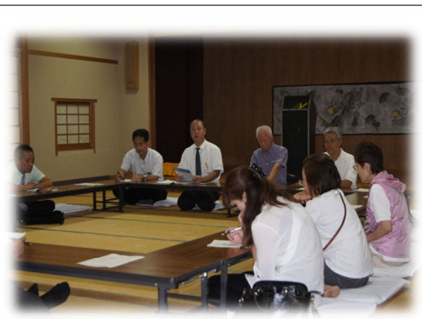
要支援把握事業 住棟合同会議の様子（10/2）