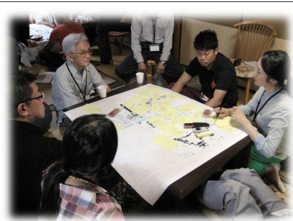
栗田学区における白川沿いの道路空間の安全・快適性の創出の推進 第1回ワークショップの様子（9/27）