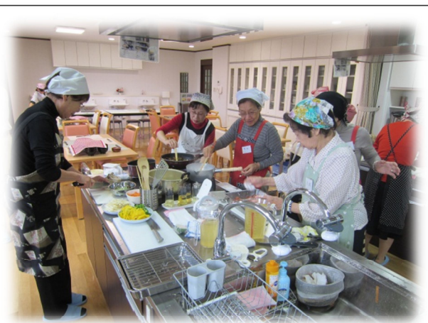
東山区における「食」を通じた地域ネットワーク活性事業 高齢期のからだにやさしい料理教室の様子（10/24）