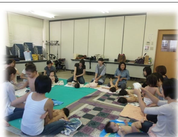
東山区における就学前育児支援事業 ベビーヨガの様子（9/27）