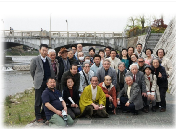
七条大橋がむすぶ七条通界わいプロジェクト 七条大橋百年目の橋渡りの様子（4/14）