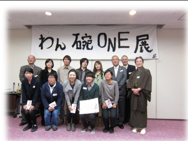
第2回「わん碗ONE」展 エンディングパーティー・表彰式の様子（11/11）