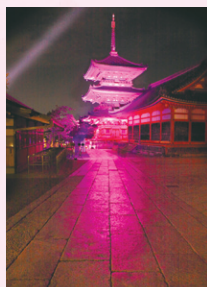
ピンクリボンライトアップ