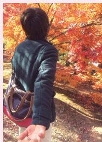
もう一度これたね