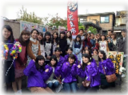
東山区まちづくり支援事業