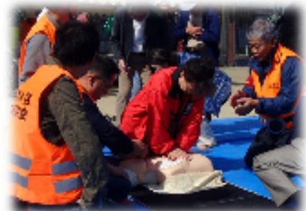
東山区総合防災訓練