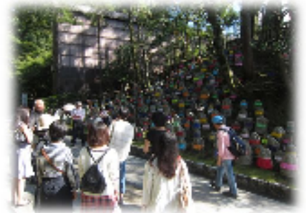
お地蔵さんまち歩き