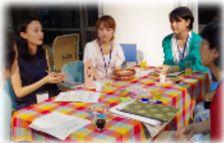
まちづくりカンファレンス