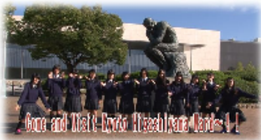
東山区未防者向けホムペ 「歩いて楽しむ東山」動画発信