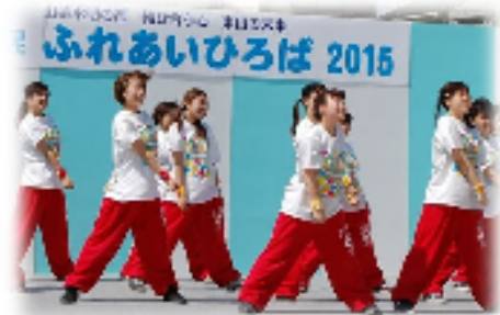
東山区民ふれあいひろば