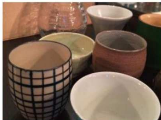
「清水焼・京焼」 レストランの食器