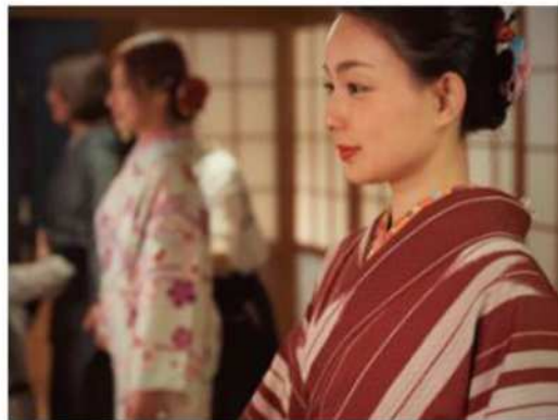
西陣織・友禅等の 「和装体験」