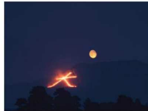
スカイビューレストランでの 「五山の送り火」鑑賞