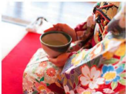
自彊室での 「茶道体験」