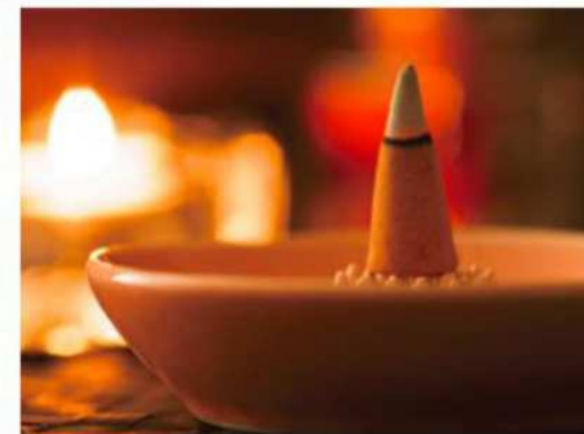
「薫香」 客室の調度品