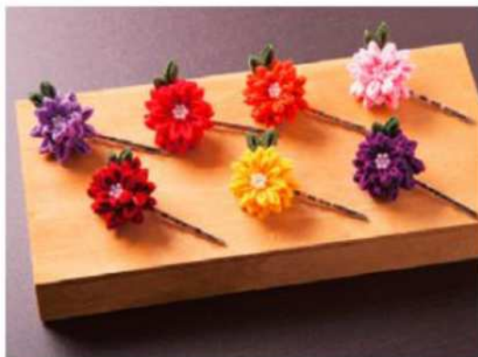
「花かんざし」 料理の花飾り