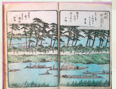
京街道千両松付近図