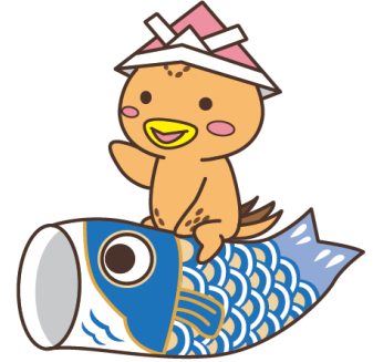
深草地域マスコットキャラクター きっちょう 深草うずらの「吉兆くん」