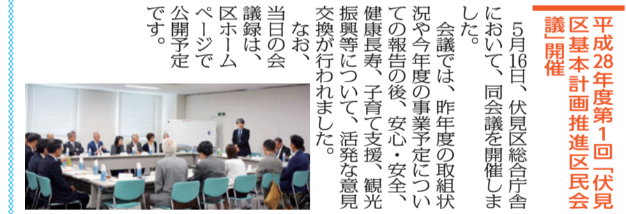
優勝した桃山東・池田東チ ームは、7月24日(日)開催 の市大会に区代表として出場 します。 【優勝】池田東チーム(壮年) 【優勝】桃山東チーム(一般) 5月16日、伏見区総合庁舎 において、同会議を開催しま した。 会議では、昨年度の取組状 況や今年度の事業予定につい ての報告の後、安心・安全 健康長寿、子育て支援、観光 振興等について、活発な意見 交換が行われました。 なお、 当日の会 議録は、 区ポ ー ム ペ ー ジ で 公 開 予 定 です。 平成28年度第1回「伏見 区基本計画推進区民会 議」開催