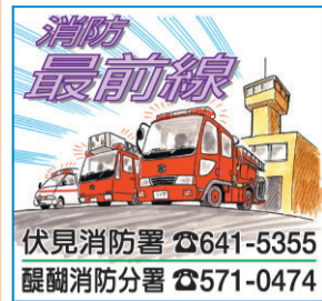
伏見消防署 ☎641-5355 醍醐消防分署 ☎571-0474

我が家の防災力を高めよう いざという時の防災力を高めるために、次のことを実施しましょう。 ●火災の初期に使用する消火器は、すぐに使用できる場所に置くことが大切です。自宅はもちろんのこと、町内や職場等の消火器の置き場所も確認しましょう。 ●玄関先等に、初期消火活動に使用する消火用ハケツを